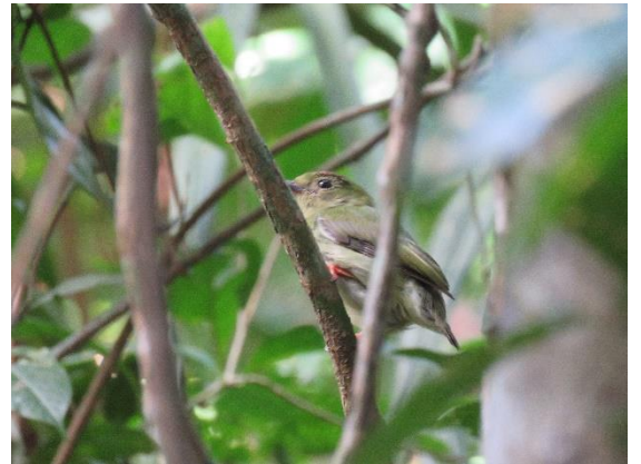
Manakin tijé sur site

La parcelle est constituée d'une forêt drainée sur pente au sous-bois lianescent en bon état de conservation.